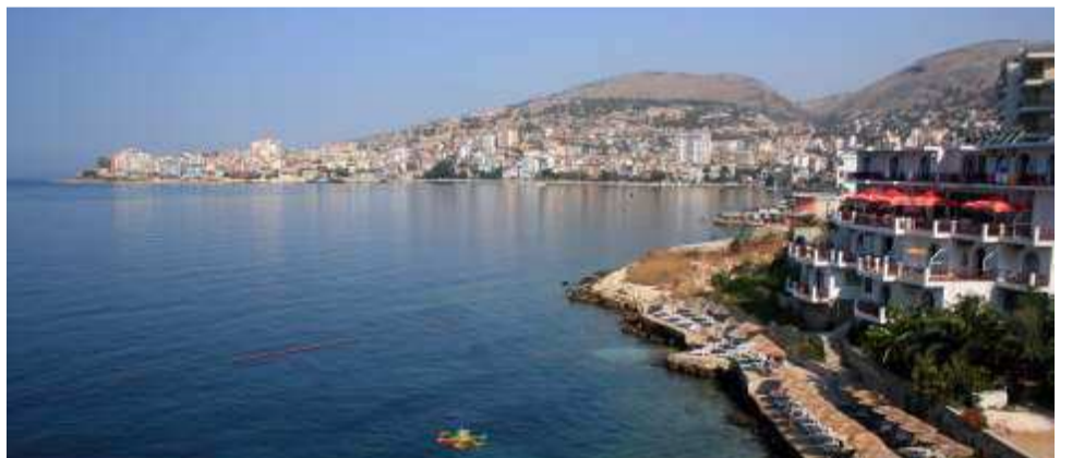
Λιμάνι Αγ. Σαράντα. Ο Ελληνικός Στρατός εισήλθε νικηφορος στις 6 Δεκεμβρίου 1940