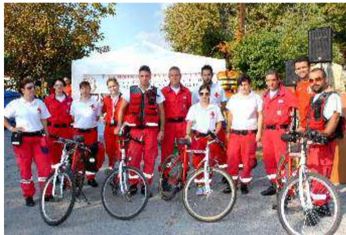
Μέλη του Ερυθρού Σταυρού και της διασωστικής ομάδας Ν. Πιερίας

Χρώμα παράδοσης έδωσαν στη διοργάνωση οι ή-