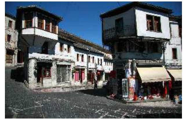
Βορεια Ηπειρος-Αργυρόκαστρο . Κεντρική οδός όπου πλήθος κόσμου με ελληνικές σημαίες υποδεχθηκε το 1940 τον Έλληνικό στρατό