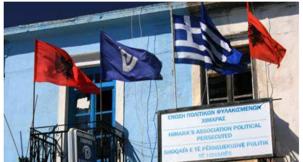
Χιμάρα . Οι κατοικοί της περίφανα για την Ελληνική καταγωγή του μεχρι σήμερα υποκεινται διώξεις για τον αγώνα του για τα δικαιωματα της Ελληνικής μειονότητας ; 790 (34)

Το Ελληνικό Έπος αποτελεί στις δύσκολες εποχές που ζούμε ένα λαμπρότατο παράδειγμα για το τί μπορούμε να πετύχουμε οι Έλληνες ενωμένοι αφήνοντας κατά μέρος τις ανούσιες πολιτικές και ιδεολογικές μας διαφορές.