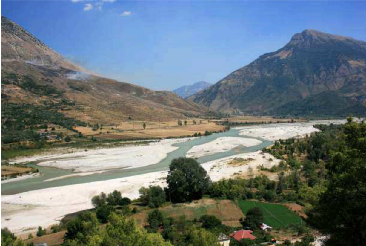
κοιλιάδα Δρίνου ποταμού . Από τα στενά αυτά ο Ελληνικός Στρατός δίνοντας σκληρές μάχες και έχοντας ήδη απελευθερώσει το Αργυρόκαστρο κατευθυνθηκε προς Τεπελένι 5 (3)