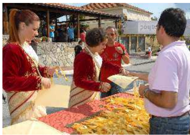
Μέλη του χορευτικού και του Δ.Σ. του Συλλόγου απονέμουν το μετάλλιο και αναμνηστικό κατά την ώρα του τερματισμού