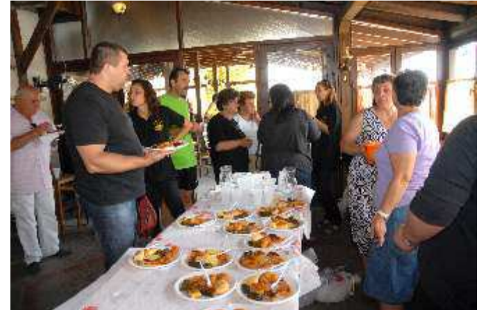
Οι γυναίκες του χωριού προσφέρουν τα ποντιακά εδέσματα στους συμμετέχοντες του αγώνα