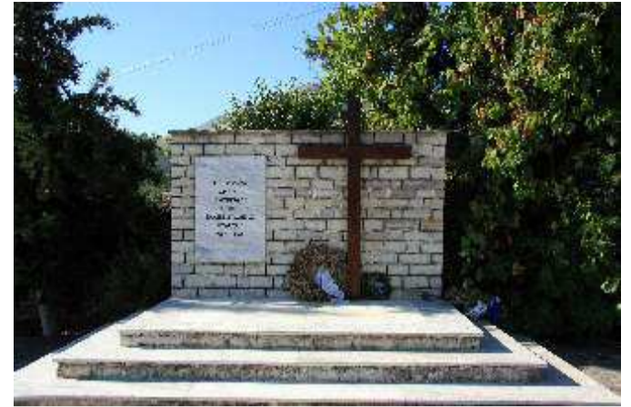
Μνημείο αγνοουμένων Ελλήνων στρατιωτών - στους Βουλαρατες