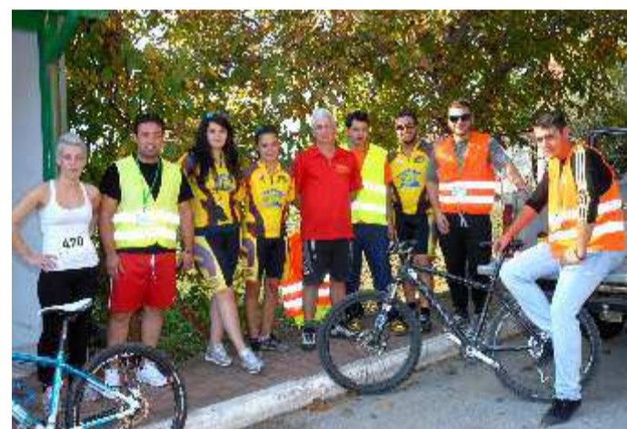
Μέλη του ποδηλατικού - περιβαλλοντικού ομίλου ΔΙΑΣ Κατερίνης

χοι της Ποντιακής Λύρας και τα εδέσματα που μεράκι ετοίμασαν οι γυναίκες του συλλόγου. Θετικά σχόλια ειπώθηκαν από όλους για το πρωτότυπο μετάλλιο και το δίπλωμα του αγώνα.