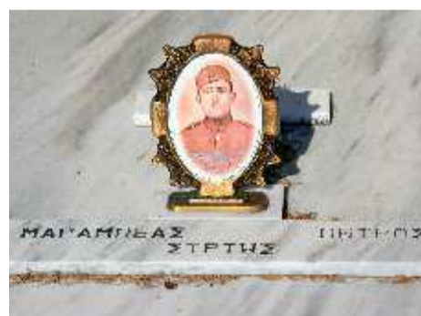
Ελληνικό κοιμητήριο στους Βουλαρατες