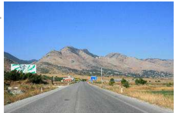
Πεδιάδα Δρόπολης Κορυφες Πλατοφουνίου. Από εδώ ξεκίνησε η Ιταλική επίθεση προς Καλπάκι. Ομως στις 1 Δεκεμβρίου οι Έλληνες κατελαβαν τα υψώματα ανοίγοντας το δρόμο προς Αργυρόκαστρο