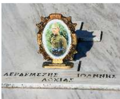
Ελληνικο Κοιμητήριο στο χωριό Βουλαρατες . Στο χωριό είχε στηθεί προκεχωρημένο νοσοκομείο εκστρατίας του ελληνικού στρατού.