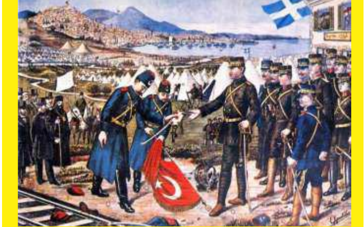
26 Οκτωβρίου 1912: ο Ταξίν Πασάς παραδίδει την Θεσσαλονίκη στον διάδοχο Κωνσταντίνο.

Έτσι το πρώτο παιχνίδι είχε κερδηθεί από την Αγγλία – Γαλλία, σε βάρος των Γερμανών και του στέμματος που ήθελε τους Γερμανούς, με επικεφαλής τον Κωνσταντίνο. Κατά συνέπεια διαβλέπουμε μια κόντρα μεταξύ του Πρωθυπουργού Ελ. Βενιζέλου και του διαδόχου Κων/νου από το 1911. Ο μεν πρώτος πιστός στην Αγγλία- Γαλλία, ο δε δεύτερος στην Γερμανία και λόγω συγγενείας του με τον Κάιζερ της Γερμανίας (η σύζυγός του ήταν αδελφή του Κάιζερ).