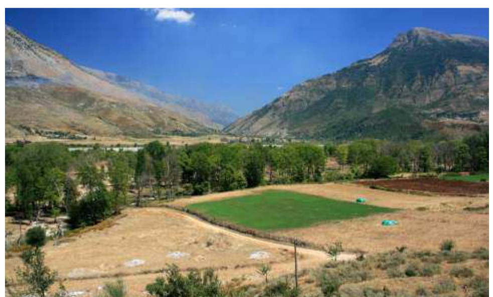
κοιλάδα Δρίνου ποταμού . Από τα στενά αυτά ο Ελληνικός Στρατός δίνοντας σκληρές μάχες και έχοντας ήδη απελευθερώσει το Αργυρόκαστρο κατευθυνθηκε προς Τεπελένι 5 (2)