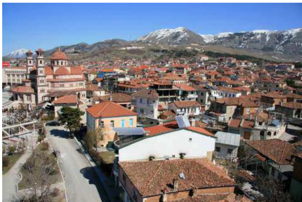
Κορτσά -στο βάθος τα υψώματα τα οποία αφού κατελαβε ο Ελληνικός Στρατός - Απόσπασμα Πίνδου εισήλθε στην πόλη όπου έτυχε θερμής υποδοχής από τους Έλληνες κατοίκους της.