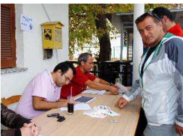
Η Γραμματεία του αγώνα την ώρα των εγγραφών λίγο πριν την εκκίνηση