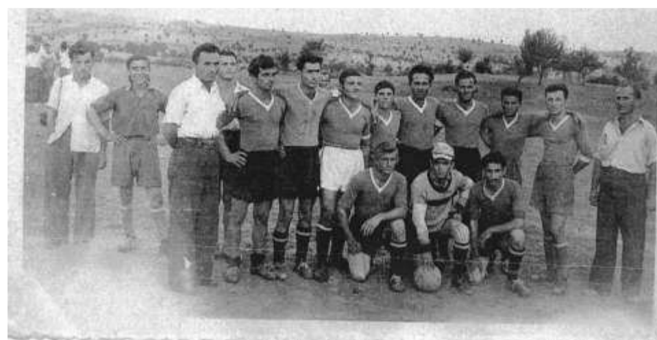
Ομάδες του 'Εθνικού Ν. Τραπεζούντας' 1931 - 1950