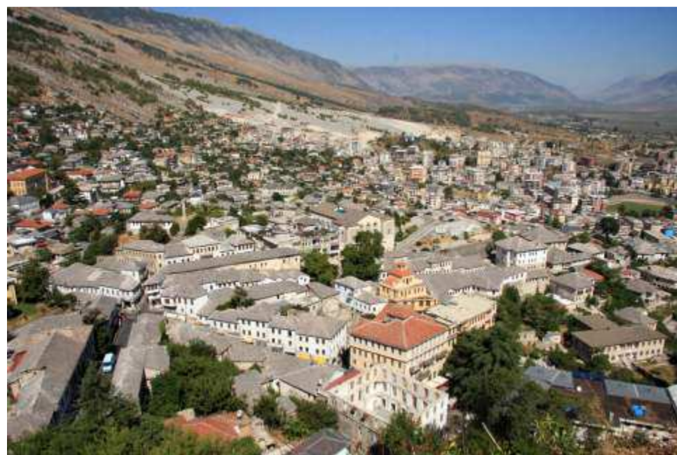
Αργυρόκαστρο - αποψη της παλαιά πόλης . Στο βαθος διακρίνεται το πέρασμα προς Τεπελένι- Στενά Δρίνου Ποταμού όπου δόθηκαν σκληρές μάχες