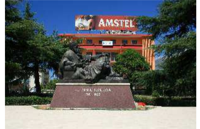
Τεπελένι - Άγαλμα του Αλή Πασα