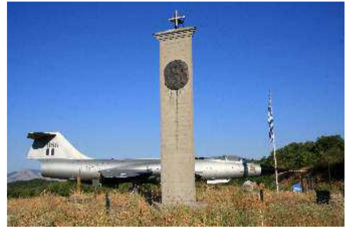
Ηρώο στο δρόμο Καλπάκι-Κακαβιά , λίγα χιλιόμετρα πριν τα Ελληνοαλβανικά συνόρα 249