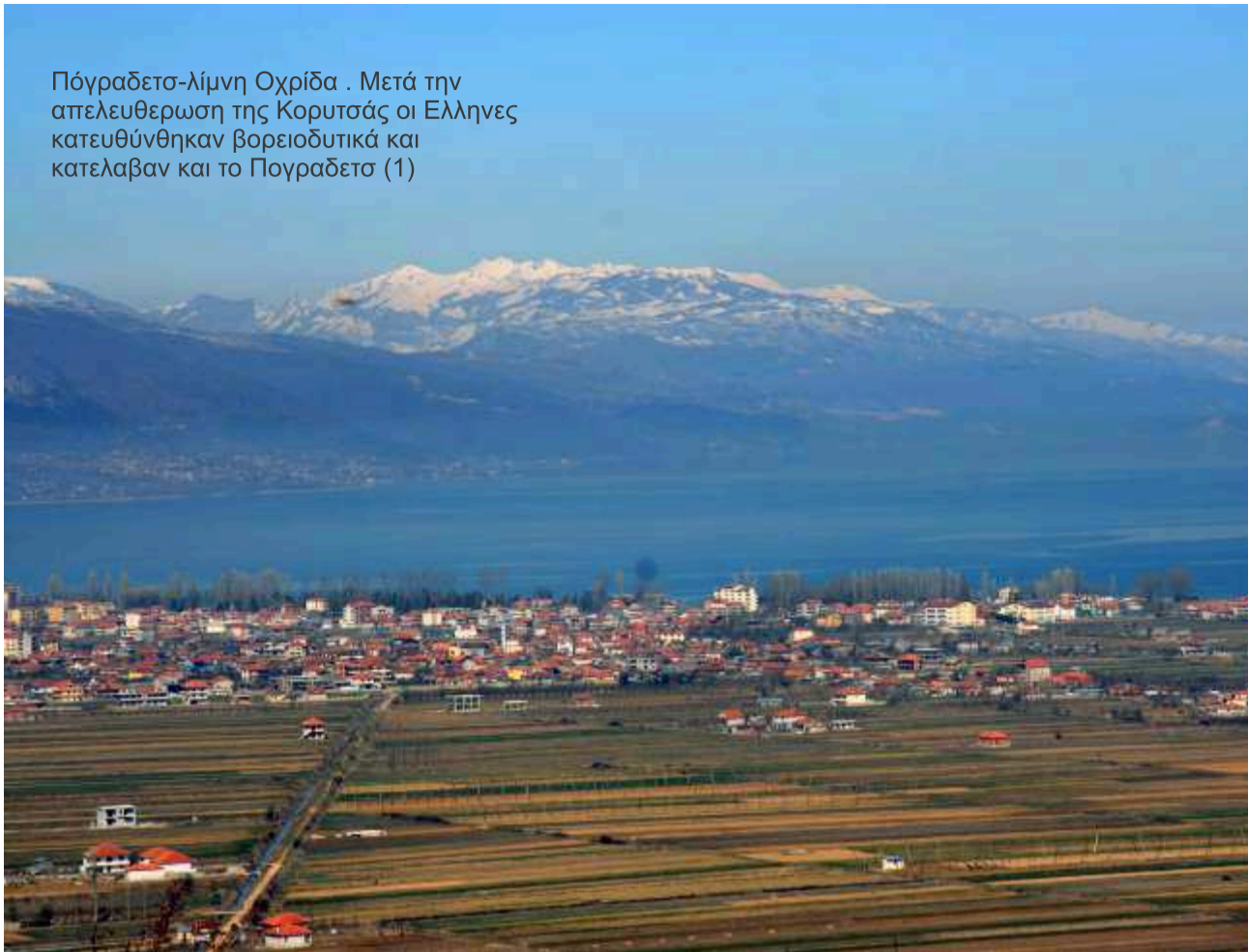
Πόγραδετο-λίμνη Οχρίδα . Μετά την απελευθέρωση της Κορυτσάς οι Έλληνες κατευθύνθηκαν βορειοδυτικά και κατέλαβαν και το Πογραδετο (1)