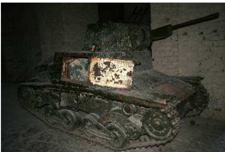
Βορεια Ηπειρος-Αργυροκαστρο ιταλικό αρμα μαχης κατεστραμένο από ελληνικό αντιαεραμικό πυροβολικό