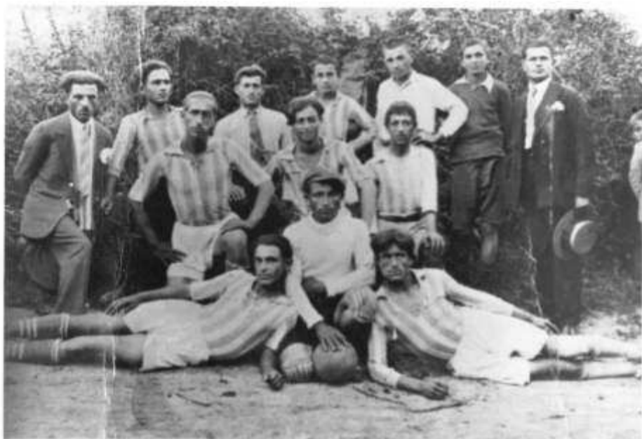
Η πρώτη ομάδα του 'Εθνικού Ν. Τραπεζούντας' 1931

Ο ιστορικός Σύλλογος του «ΕΘΝΙΚΟΥ», υφίσταται από την αρχή σχεδόν της ίδρυσης του χωριού και χάρισε άπειρες συγκινήσεις στους κατοίκους του.