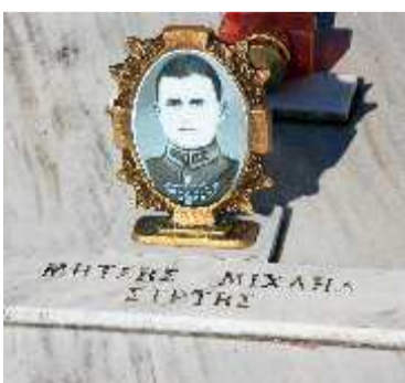
Βουλαράτες -Ελληνικό Κοιμητήριο το οποίο συντηρείται από τους μόνιμους βορειοηπειρώτες κατοίκους του χωριού μεχρι και σήμερα.