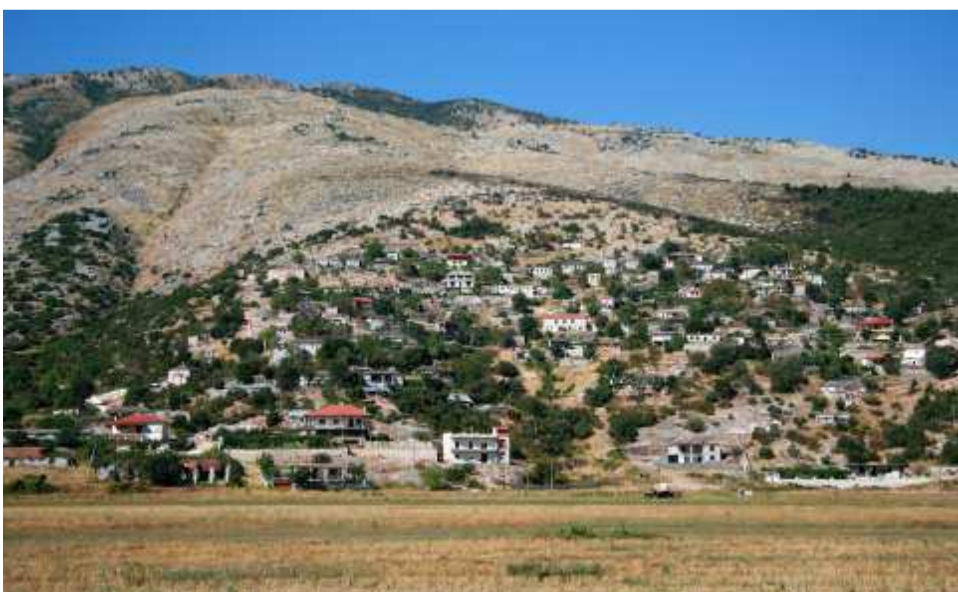
Βόρεια Ηπειρος ελλ. χωρια στην πεδιάδα της Δροπολης Στα υψωματα αυτά δόθηκαν σκληρές μάχες κατά την ελληνική αντεπίθεσή με κατευθυνση προς Αργυρόκαστρο